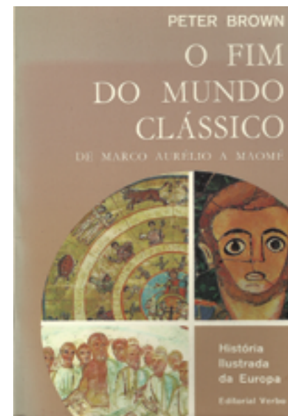
Figura 1 Capa da primeira edição, em português, do livro O fim do mundo clássico: de Marco Aurélio a Maomé . A obra foi editada em Lisboa, em 1972, pela Editora Verbo.