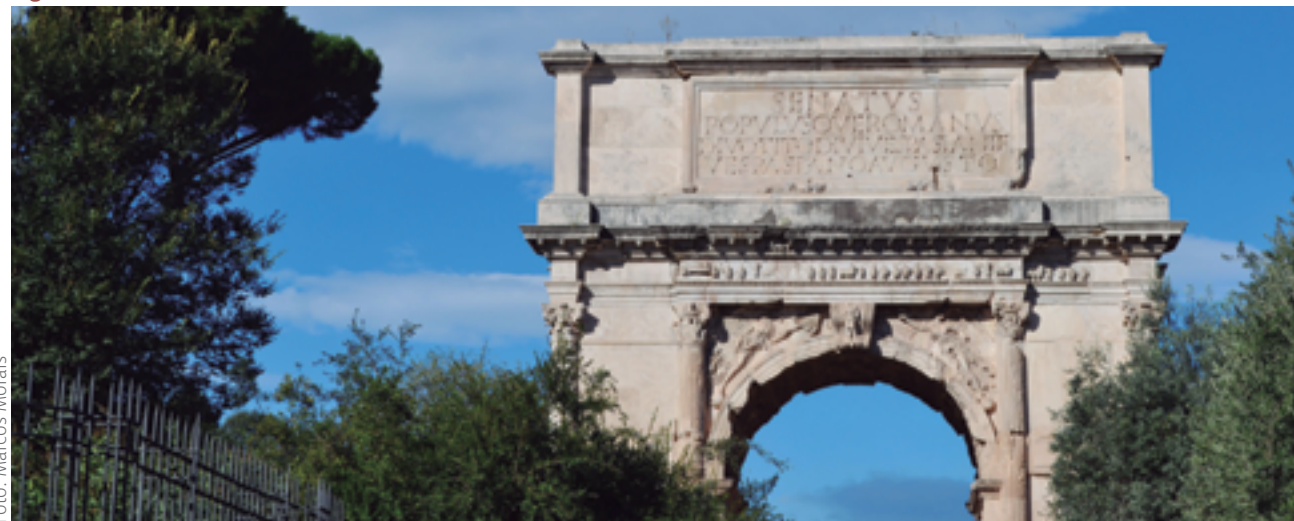
Figura 4 Arco do Triunfo de Tito, localizado no Fórum em Roma

A Roma cristã é representada não somente, mas também pela topografia urbana. A historiografia tradicional evoca a transformação da paisagem urbana para denotar o avanço e o triunfo do cristianismo na sociedade romana da Antiguidade Tardia. Na época constantiniana, de fato, construíram-se basílicas e edifícios para as reuniões dos adeptos do cristianismo. Isso não significa pensar, no entanto, que os cristãos não tinham lugares de reuniões anteriormente. Os cristãos faziam uso de espaços privados