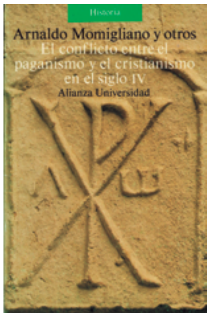
Figura 2 Capa da primeira edição, em espanhol, do livro El conflicto entre el paganismo y el cristianismo en el siglo IV , organizado por Arnaldo Momigliano. A obra foi editada em Madri, em 1989, e, até o presente momento, ainda não teve uma edição em língua portuguesa.

que emerge, grosso modo , é a do advento de um cristianismo inovador, ofensivo que triunfa sobre um paganismo tolerante e estagnado no contexto dos últimos séculos do Império Romano, que era concebido com um período em declínio. Em 1891, por exemplo, foi publicada a obra La fin du paganisme: études sur les dernières luttres religieuses en Occident au quatrième siècle , de Gaston Boissier, no qual a relação entre cristianismo e paganismo é estabelecida considerando-se “os principais incidentes” que implicariam o “fim do paganismo”, evidenciando-se “de que maneira o cristianismo recorre à arte e às ideias antigas” e “triunfa” sobre seu oponente, o paganismo (1891, p. 57). Esse padrão de interpretação das relações paganocristãs remonta ainda ao século XVIII, na esteira da interpretação presente na obra capital A história do declínio e queda do Império Romano , de Edward Gibbon. De fato, um dos capítulos da obra de Gibbon somente em seu título já destaca aquela perspectiva: “O triunfo da ortodoxia e a destruição final do paganismo”. Todavia, nas últimas décadas, essa perspectiva tradicional das relações entre paganismo e cristianismo tem sido